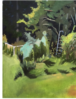
Aspergeloof oil paint on paper 30 x 40 cm 2023 €525