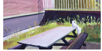
Dakterras oil paint on paper 51,5 x 26 cm 2021 €685