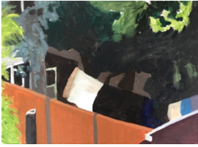
Binnentuin oil paint on paper 31 x 22,5 cm 2021 €400