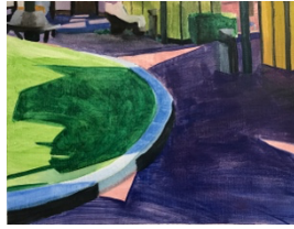
Staringplein III oil paint on paper 31 x 24 cm 2021 €400