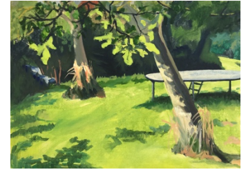
Walnotenboomgaard oil paint on paper 40 x 30 cm 2023 €525