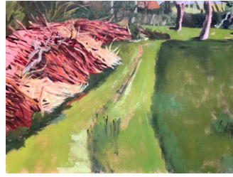
Takkenwal oil paint on paper 40 x 30 cm 2024 €525