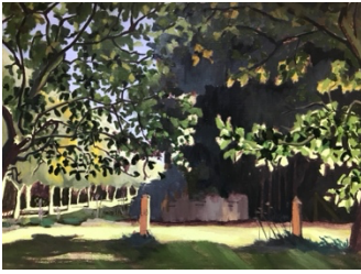
Donker bosje oil paint on paper 40 x 30 cm 2024 €525